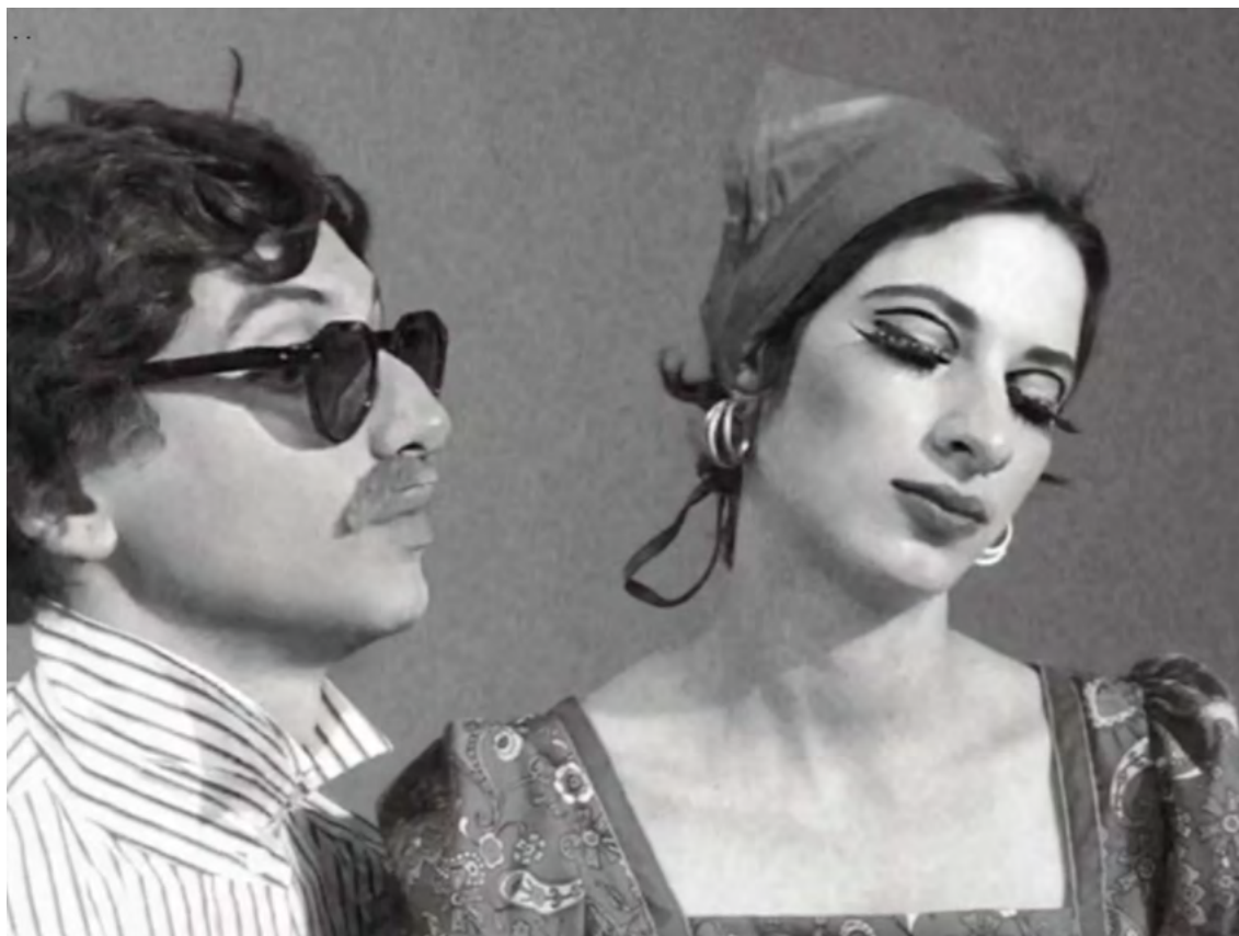
TWIGGY, 2022 starring Paula Kletschke